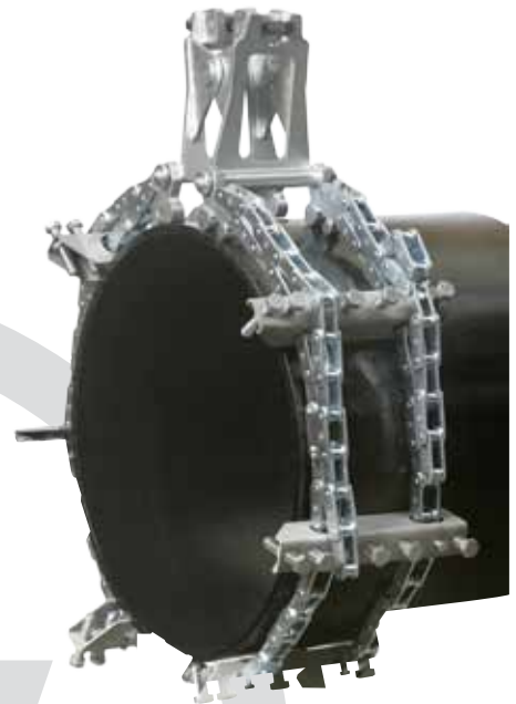
Grampo de tubo manual

O sistema flexível “fácil de manusear”, para ser utilizado tubo a tubo, tubo a curva e curva a T ou flange – alinhe e ajuste e está pronto a soldar em menos de 10 minutos!